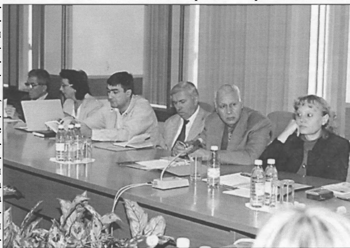
В разгорещена дискусия на Кръглата маса бе обсъдена ролята на контролните органи

терството на икономиката и Държавен фонд "Земеделие" към МЗГ по-активно да работят за усвояване на средствата от предприемаческите програми на ЕС, в това число за въвеждане на системата НАССР.